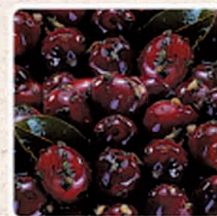
OLIVE NERE GIGANTI