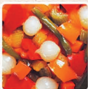
CONTORNO DI VERDURE