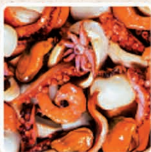
INSALATA DI MARE