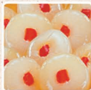
CIPOLLINE AL PEPERONE