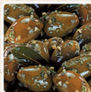
OLIVE VERDI GIGANTI