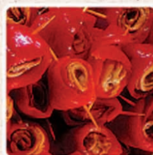
PEPERONI CON ALICI