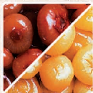
CIPOLLINE BORRETANE ALL'ACETO BALSAMICO E IN AGRODOLCE