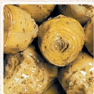
CARCIOFI ALLA ROMANA